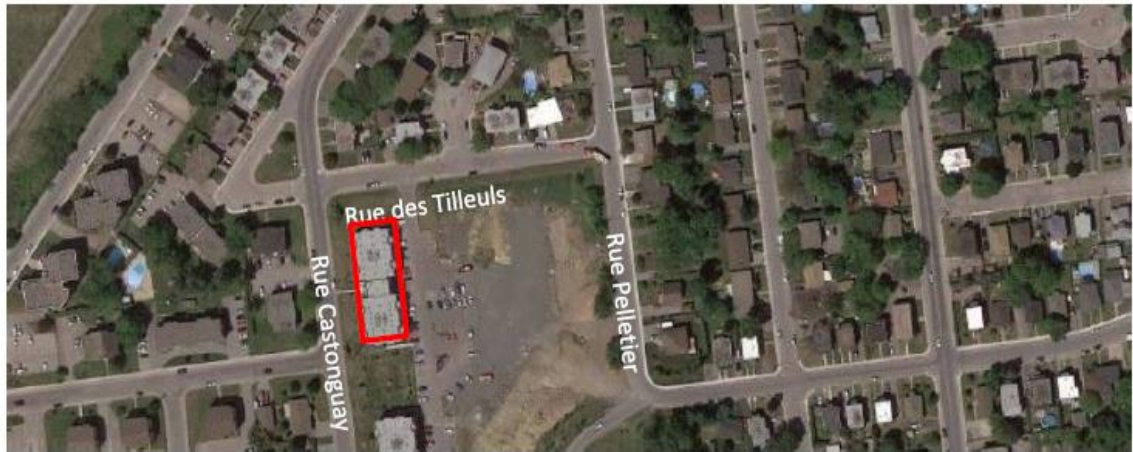
Figure 1 : Localisation du 467, rue Castonguay