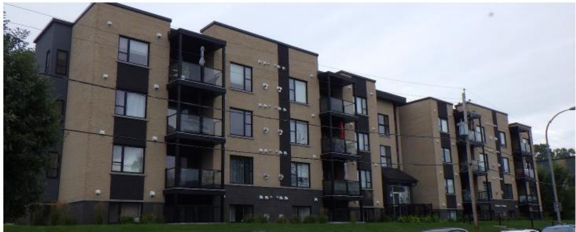
Figure 2 : Façade rue Castonguay